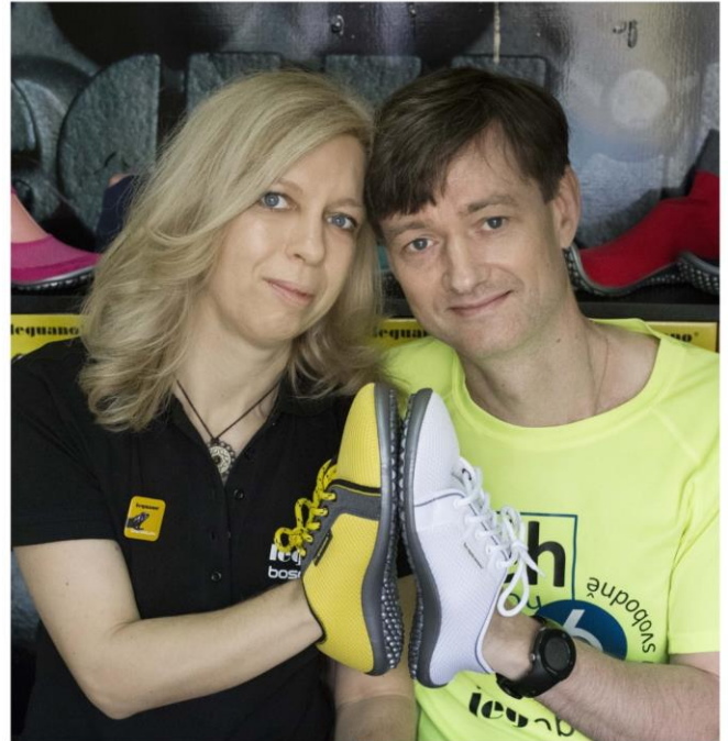
Team bosoboty leguano

Vážení přátelé, vážení příznivci zdravého životního stylu, od veletrhu a kongresu pro terapii, léčebné rehabilitace a prevence Therapie v Lipsku v březnu 2015, píšeme v České republice příběh zdraví prospěšné chůze v bosobotách leguano. Nám je v nich opravdu dobře a jsme velmi rádi, že si tato kvalitní německá značka našla rychle mnoho příznivců na českém trhu. Příroda přivedla člověka na svět bez bot a na to bychom neměli zapomínat. V zemích, v nichž se chodí ještě dnes převážně naboso, jako např. Indie, jsou civilizační choroby zad, kloubů a chodidel ojedinělé. K naší západní kultuře ovšem patří chození v botách a s tím je spojeno velké množství potíží. Klasická bota působí na naši nohu obdobně jako sádra. Chrání nohu zvenčí. Noha zůstává pasivní a nemusí aktivně udržovat nožní klenbu. Důsledkem je, že nožní svalovina ochabuje, a to může mít různé následky, jako je plochá nebo příčně plochá noha. Protože nohy tvoří základ našeho těla, působí každé chybné postavení nohy negativně na celkovou statiku našeho těla. Princip bosobot leguano je tak jednoduchý, až je geniální. Chůze v bosobotách leguano není jen klasickou chůzí, je to filozofie zdravého životního stylu. Zažijte i Vy ten úžasný pocit svobodné chůze s prožitkem a vylepšete si své zdraví!