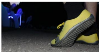
leguano aktiv po téměř ročním běhání (fotografie pořízená při Neon Run 3.9.2016 v oboře Hvězda)

Běhám s přestávkami tak od patnácti let, ale tak skvělé pocity, jako při běhu v bosobotách leguano jsem ještě nezažil. Od konce září 2015 běhám ve žlutých aktiv 44 a mám v nich naběháno zhruba 650 kilometrů. Zatím jsou ve velmi dobrém stavu a myslím, že vydrží i více než deklarovaných 800-1000 km na asfaltu. Další zkušenosti a něco o tom, jak vypadá moje supinace, napíši příště.