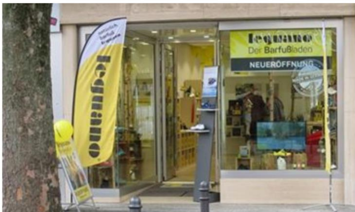
V německém Kolíně nad Rýnem byl 11. srpna 2016 otevřen už 59. obchod bosoboty leguano v Německu. Seznam všech obchodů naleznete na www.leguano.eu