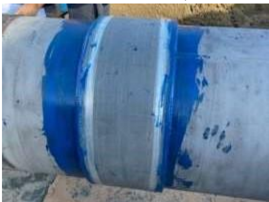
WrapWrap vyztužený 24" obvodovým svarem