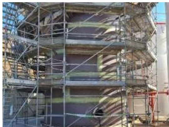
Zesílení konstrukce v místech defektů na svarech nádrží.