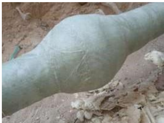
Přetěsnění a bandážování netěsné příruby

Vždy správná oprava pomocí kompozitních materiálů.