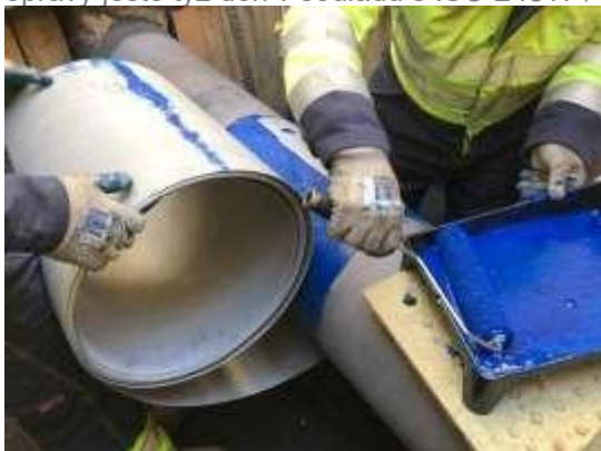
Jednoduchá instalace 18" širokého kompozitu PermaWrap

Všechny výrobky WrapMaster® byly plně testovány podle všech požadavků ASME PCC2 čl. 4.1 a ISO 24817. Organizace PRCI dokončila další testování objímek PermaWrap® a WeldWrap®, aby prokázala jejich dlouhodobou spolehlivost a odolnost. Testy PRCI rovněž prokázaly, že kompozitní objímka PermaWrap® a WeldWrap® je lepší a nákladově efektivnější metodou opravy promáčklin a provalení. Společnost Open Water Management je schopna poskytnout službu výpočtu požadavků na opravy ještě týž den v souladu s ISO 24817 / ASME PCC2 4.1 / WrapMax.