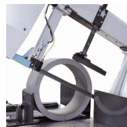
Poziční senzor - standard