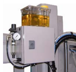
Mikrosprej - opce

Hydraulická poloautomatická pila, vhodná k řezání konstrukční oceli, trubek, profilů a nosníků. Úhlové řezání do 60° vlevo a vpravo , snadné zastavení při 0°, 45° vlevo a 45° vpravo.