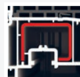
výztuha v křídle