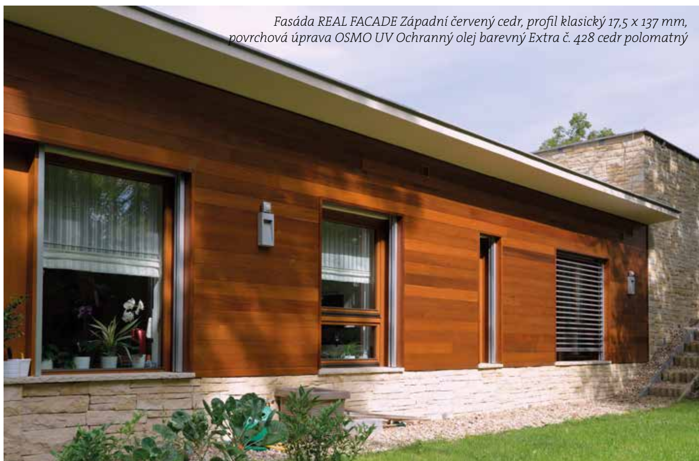
Fasáda REAL FACADE Západní červený cedr, profil klasický 17,5 x 137 mm, povrchová úprava OSMO UV Ochranný olej barevný Extra č. 428 cedr polomatný