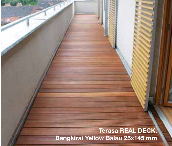
Terasa REAL DECK, Bangkirai Yellow Balau 25x145 mm

Terasy z dřeviny Bangkirai dodáváme vzduchsuché s vlhkostí do 25%. Jádrové dřevo má v čerstvém stavu žlutohnědý až nazelenalý vzhled, často ale ztmavne v olivově hnědou. Barevné rozdíly mezi jednotlivými prkny jsou přirozené a obvyklé. Jako jedno z nejodolnějších dřev vykazuje jádrové dřevo, které se ne vždy zbaví světlejší běli, vysokou odolnost proti plísni a hmyzu. Letokruhy nejsou znatelné, suché dřevo je bez zápachu. Ve dřevě se mohou vyskytnout otvory od hmyzu, které však neovlivňují trvanlivost a statické vlastnosti. Dřevo je velmi tvrdé a má dlouhou životnost díky vysoké hustotě a obsaženým látkám. Tyto olejnaté obsažené látky mohou být během první fáze vystavení povětrnostním podmínkám vyplaveny deštěm. Z toho důvodu musí být dřevo umístěné na terasách či balkonech použito tak, aby voda stékající ze dřeva byla odvedena okapy a dešťovými žlaby. Plocha terasy by se měla upravit olejem ca. 2–3 měsíce po pokládce, kdy dojde k přirozenému úbytku obsažených látek ze dřeva. Bez provedeného ošetření zůstává dřevo bez újmny a časem se vytvoří na povrchu dřeva šedo–stříbrná patina. S OSMO Terasovým olejem můžete dřevo na dlouhou dobu opticky zhodnotit. Pro správnou funkčnost terasy je bezpodmínečně nutné dodržet základní pravidla pro pokládku dřevěných teras a vytvoření dostatečně stabilní podkladní konstrukce. Pro podkladní konstrukci má být kvůli rovnoměrnému nabobtnání a smršťování použito pouze