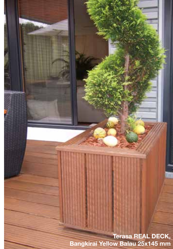
Terasa REAL DECK, Bangkirai Yellow Balau 25x145 mm

dřevo stejné nebo podobné hustoty jako dřevo pochozí. Pro správnou údržbu a čištění si vyžádejte od našich prodejců technické podmínky a pokyny na údržbu terasových prken.