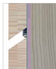
Vzdálenost spáry se automaticky nastaví hlavou profilového vrutu, hotovo!