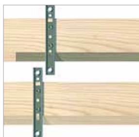
Postup opakujte při osazování veškerých dalších fasádních profilů.