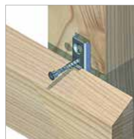
Fasádní profil přišroubujte ke kontra latě.