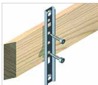
Klip na fasády přiložte zarážkou na zadní straně a zašroubujte profilový vrut.