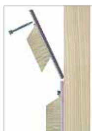
Další profil jednoduše zasuňte a pouze na horní straně přišroubujte profilovým vrutem.