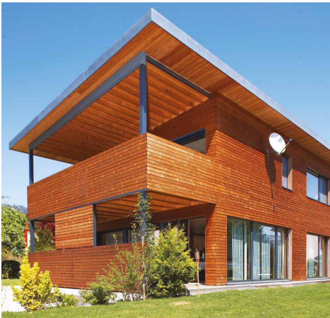
Fasáda REAL FACADE, Thermo borovice profil Raute 26 x 92 mm, ponecháno přírodní