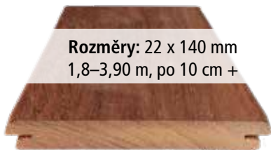
Pohledová strana = hladká

Rozměry: 22 x 140 mm 1,8–3,90 m, po 10 cm +