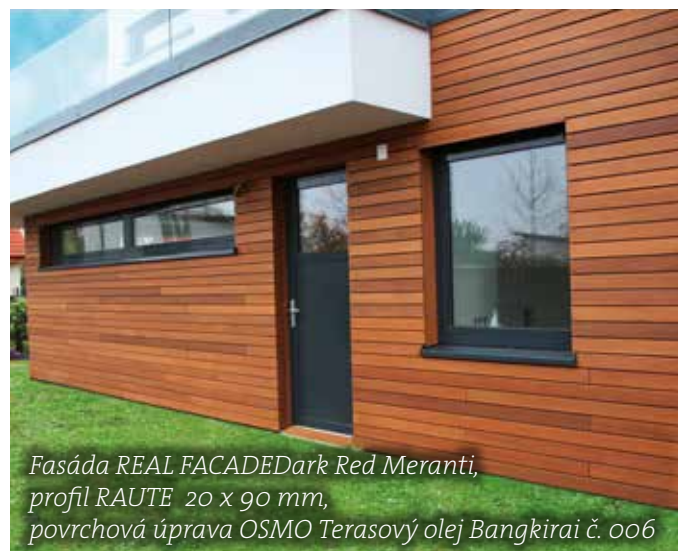
Fasáda REAL FACADE Dark Red Meranti, profil RAUTE 20 x 90 mm, povrchová úprava OSMO Terasový olej Bangkirai č. 006