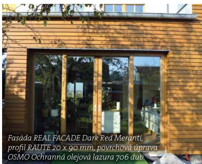
Fasáda REAL FACADE Dark Red Meranti, profil RAUTE 20 x 90 mm, povrchová úprava OSMO Ochranná olejová lazura 706 dub.