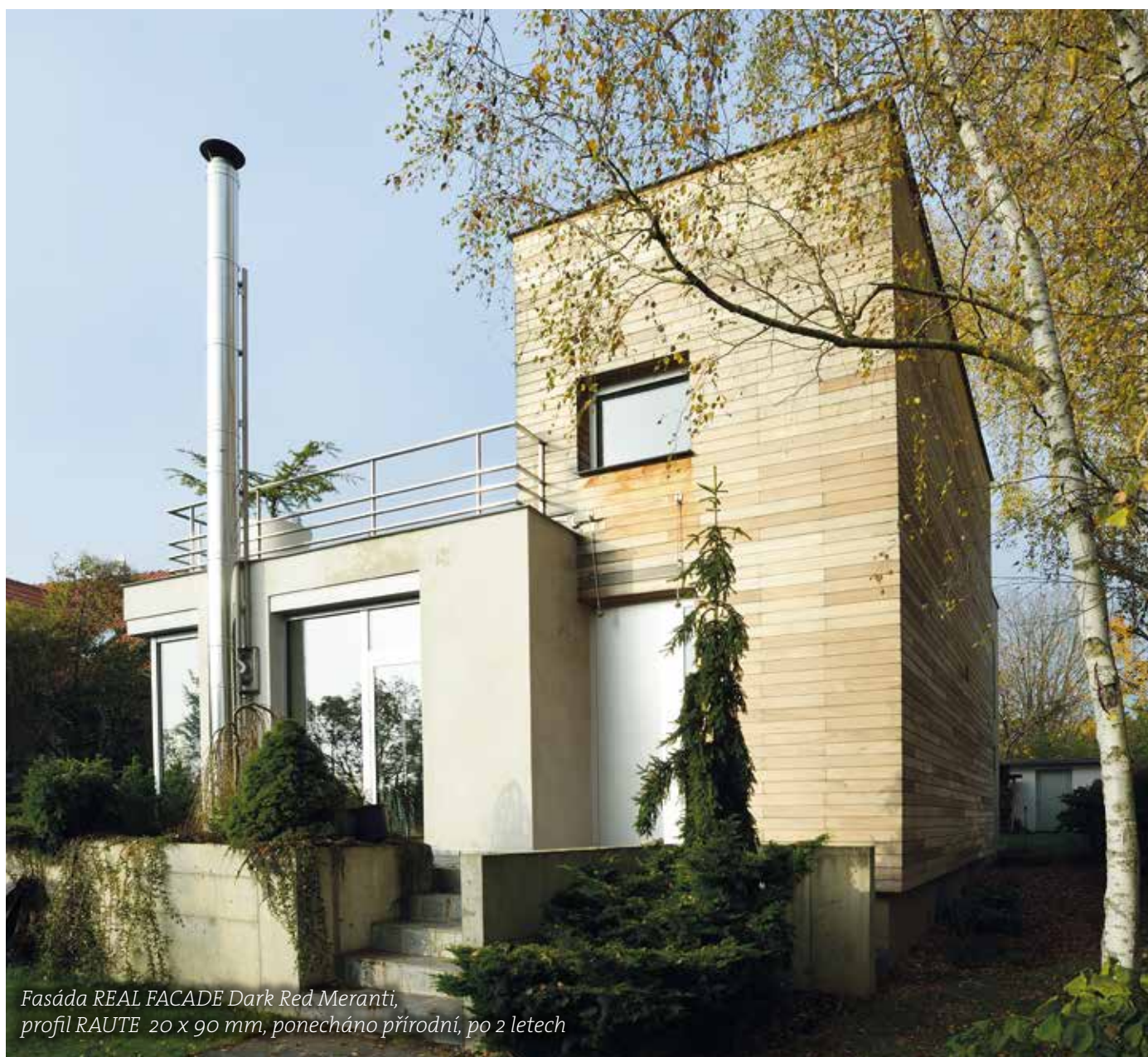
Fasáda REAL FACADE Dark Red Meranti, profil RAUTE 20 x 90 mm, ponecháno přírodní, po 2 letech