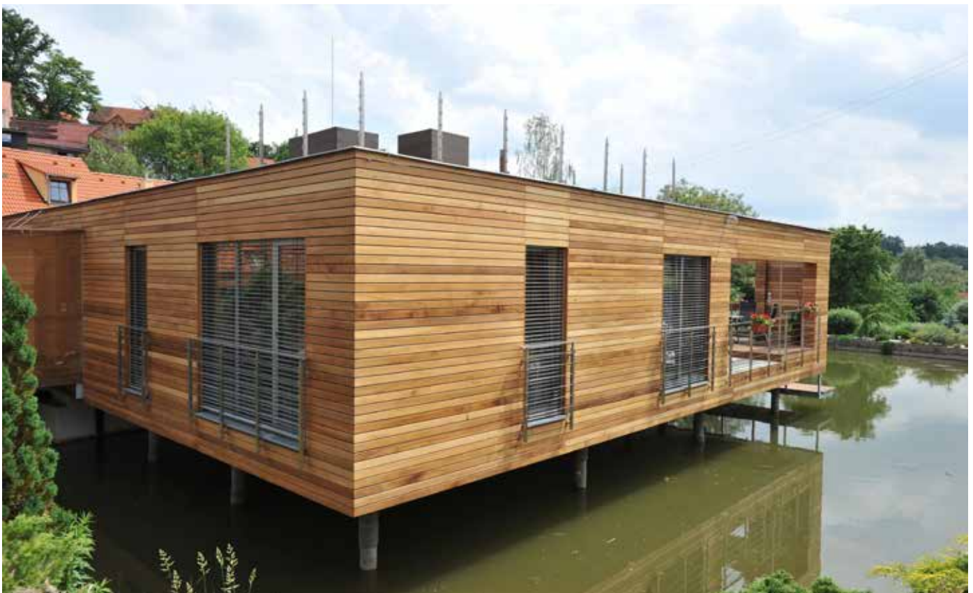
Fasáda REAL FACADE, Dark Red Meranti, profil Raute 20 x 90 mm, povrchová úprava OSMO UV Ochranný olej bezbarvý č. 420