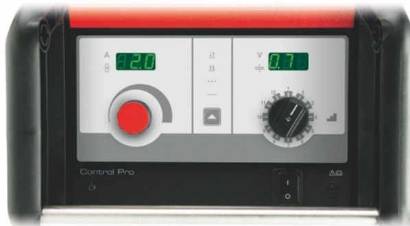
Ovl. panel ControlPro