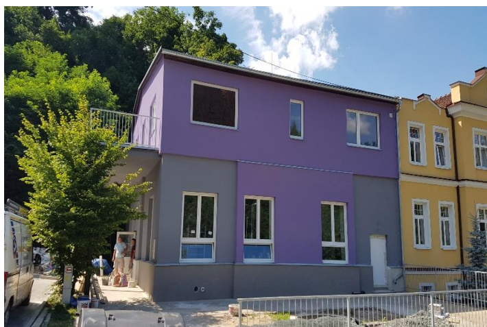
DDP Bílovice nad Svitavou, Komenského 314

Dům domácí péče (DDP) Bílovice byl otevřen 2016. Je to odlehčovací pobytové zařízení, které se nachází v obci nedaleko Brna - v Bílovicích nad Svitavou. Pokoje jsou 1-3lůžkové. Uživatelé mají k dispozici venkovní posezení. Zařízení je zaměřené na péči o seniory a těžce zdravotně postižené klienty. Zaměřujeme se zejména na podporu při naplňování potřeb seniorů, kteří mají sníženou soběstačnost v důsledku pokročilého věku a jejichž situace vyžaduje pravidelnou pomoc jiné fyzické osoby. Náš dům je také vhodnou alternativou pro seniory, kteří mají přidruženou lehčí formu smyslové vady a potřebují pobytové služby sociální péče.