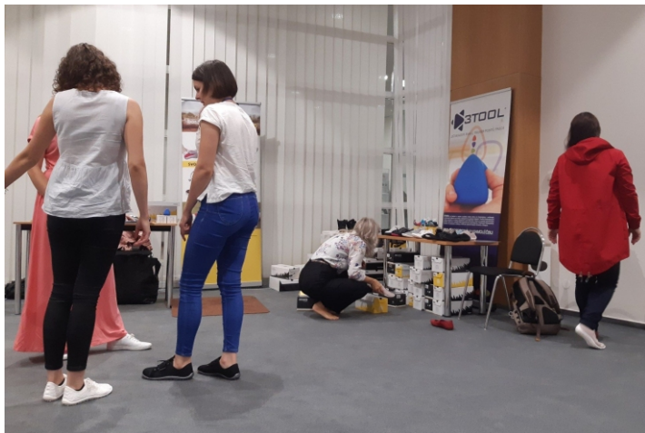
Vystavovali jsme na sjezdu Unie fyzioterapeutů. Další informace naleznete na www.unify-cr.cz