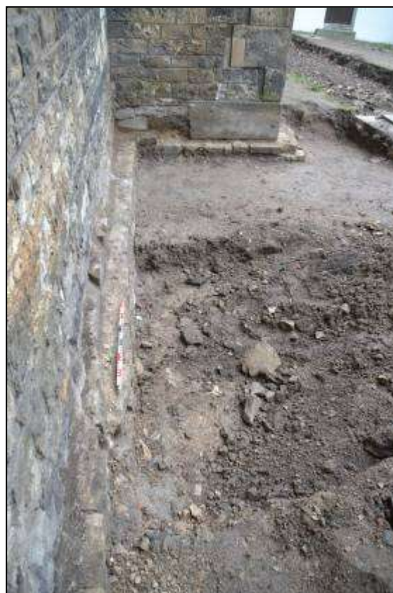
Obr. 05. Foto vpravo - detail předzákladu u obvodové severní zdi lodě, předzáklad vystupuje maximálně o 20 cm, někdy i méně; text i foto I. Peřina.