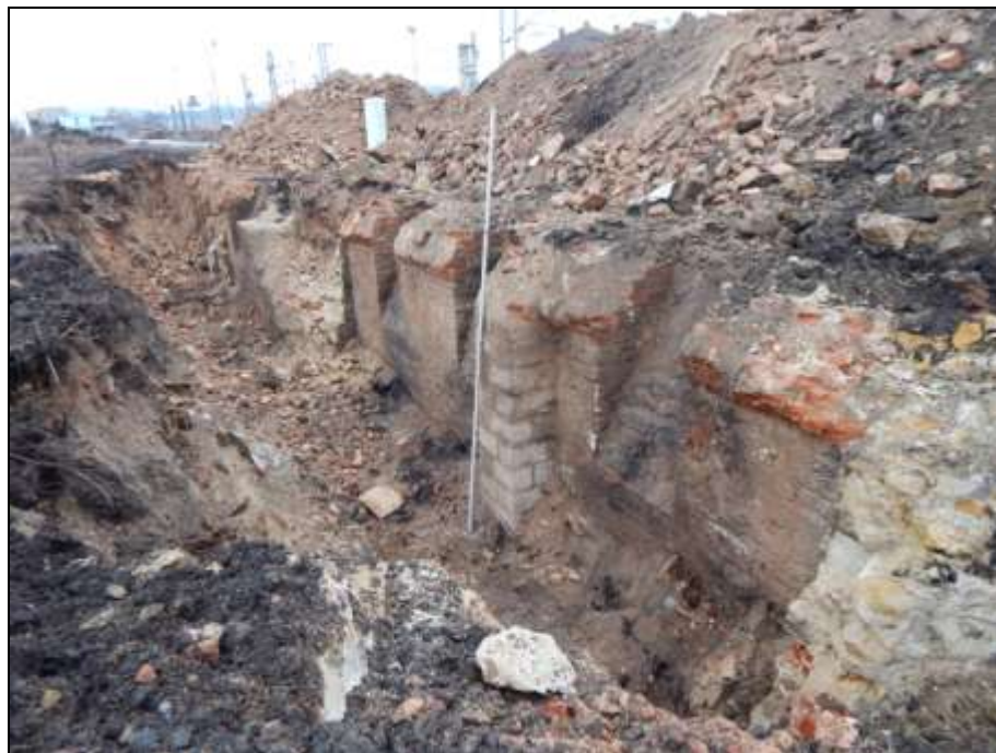
Obr. 02. Rozsáhlý liniový výkop podsklepenou částí blokové zástavby domů při ul. Práce.