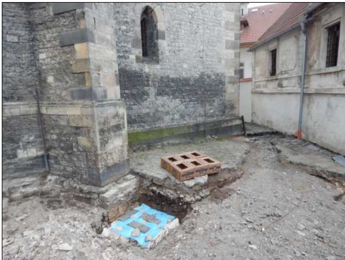
Obr. 07. Místo uložení dislokovaných lidských kosterních pozůstatků u prvního opěrného pilíře severní části lodi; foto A. Káčerík.