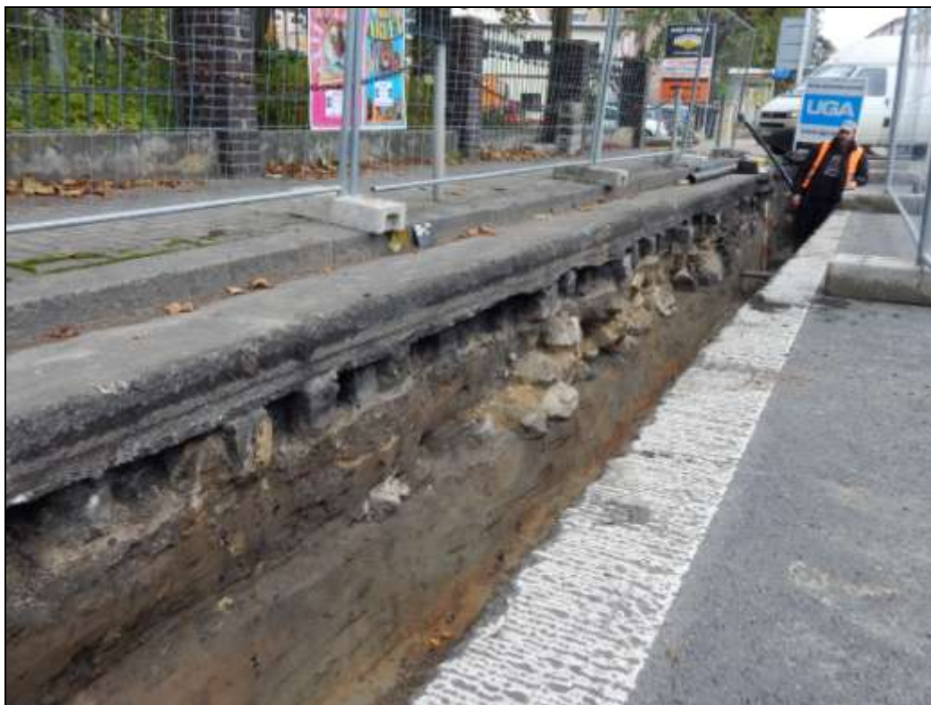
Obr. 11. Pohled od JV na jednu z rozsáhlejších nálezových situací s kamennou stavební konstrukcí založené do jílovitopísčitých sedimentů levobřežní „labské terasy“; foto A. Káčerik.

Dosud jsme identifikovali 4 úseky s pozitivním výskytem archeologických situací (subtilní mělká kamenná zdiva), které ovšem nebylo možné pro absenci datujícího materiálu zařadit na časové ose. Předpokládáme, že se nám po ukončení terénní části, při analýze archivních materiálů, podaří některé ze zjištěných stavebních konstrukcí zasadit do širšího nálezového kontextu.