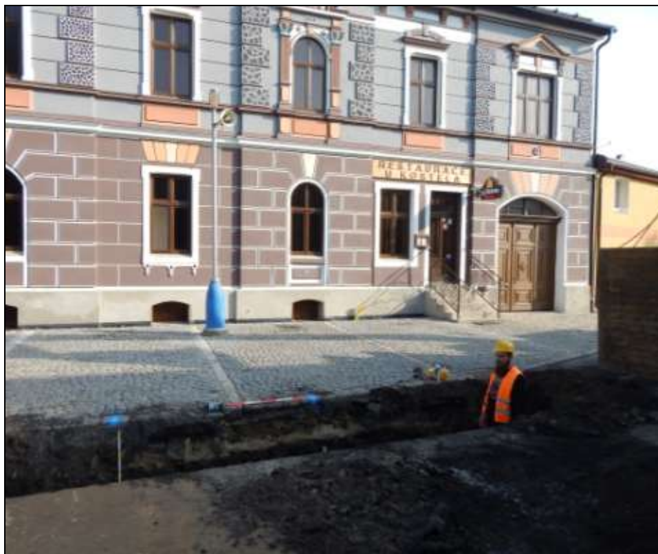
Obr. 03. Ul. Komenského, stoka C, sektor 08.

Průběžně je převáděna dosavadní terénní kresebná dokumentace do digitálního formátu. Veškeré movité archeologické nálezy po základním laboratorním ošetření včetně originální terénní dokumentace budou po dobu zpracování uloženy v sídle společnosti. Následně bude v souladu s legislativou zahájeno jednání o jejich převodu do vlastnictví Ústeckého kraje. Výsledky výzkumu budou komplexně shrnuty do závěrečné nálezové zprávy, která bude v zákonné lhůtě odevzdána Archeologickému ústavu Akademie věd ČR v Praze.