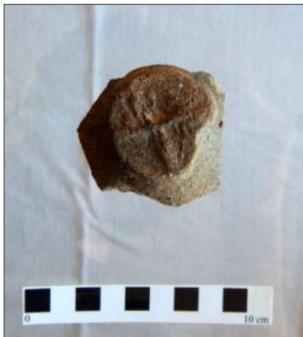
Obr. 09. Detail plastického provedení typu hrnčírské značky aplikované na úchytce pokličky; foto A. Káčerik.