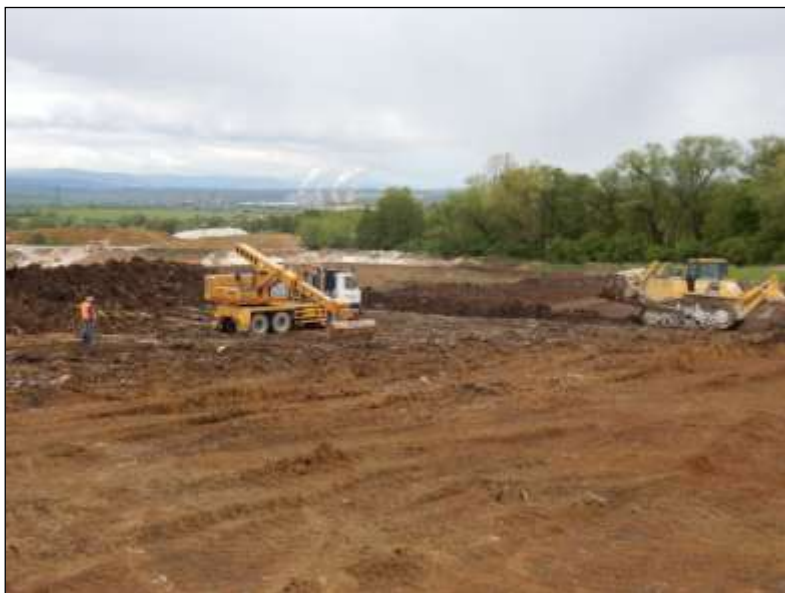
Obr. 08. Mechanizovaná skrývka ornice s podorničím; foto A. Káčerik.

V současné době je převáděna terénní plánová kresebná dokumentace do digitálního formátu. Veškeré movité archeologické nálezy po základním laboratorním ošetření včetně originální terénní dokumentace budou po dobu zpracování uloženy v sídle společnosti. Následně bude v souladu s legislativou zahájeno jednání o jejich převodu do vlastnictví Ústeckého kraje. Výsledky výzkumu budou komplexně shrnuty do závěrečné nálezové zprávy, která bude v zákonné lhůtě odevzdána Archeologickému ústavu Akademie věd ČR v Praze.