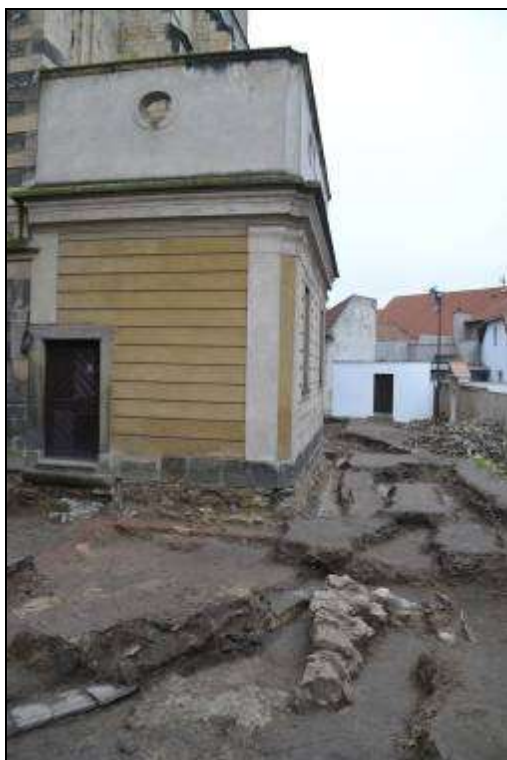
Obr. 04. Foto vlevo - plošný odkryv v části na V od sakristie; ponechané bloky terénu představují zásypy recentních výkopů; foto I. Peřina.

V současné době je převáděna terénní plánová kresebná dokumentace do digitálního formátu. Veškeré movité archeologické nálezy po základním laboratorním ošetření včetně originální terénní dokumentace budou po dobu zpracování uloženy v sídle společnosti. Následně bude v souladu s legislativou zahájeno jednání o jejich převodu do vlastnictví Ústeckého kraje. Výsledky výzkumu budou komplexně shrnuty do závěrečné náleзовé zprávy, která bude v zákonné lhůtě odevzdána jak Archeologickému ústavu Akademie věd ČR v Praze, tak i v tomto případě Národnímu památkovému ústavu, územně odbornému pracovišti v Ústí nad Labem (Krásném Březně).