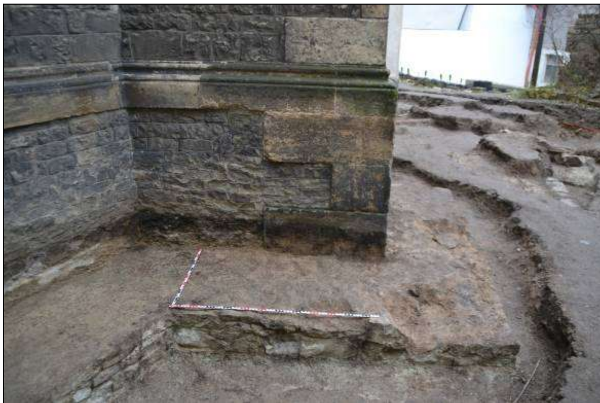
Obr. 06. Předzákladové mohutné zdivo (vystupuje o 80 cm) u pátého opěrného pilíře. Zdivo kopíruje dispozici nadzemní stavby; text i foto I. Peřina.